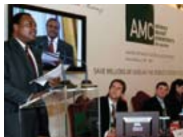
MINISTERO DELL'ECONOMIA E DELLE FINANZE, ITALIA

2007 Canadá, Italia, Noruega, Rusia, Reino Unido y la Fundación Bill & Melinda Gates se comprometen a invertir 1.500 millones (USD) en un Compromiso Anticipado de Mercado (AMC, siglas en inglés de Advance Market Commitment ) para ayudar a acelerar el desarrollo y la disponibilidad de una nueva vacuna contra enfermedades neumocócicas.