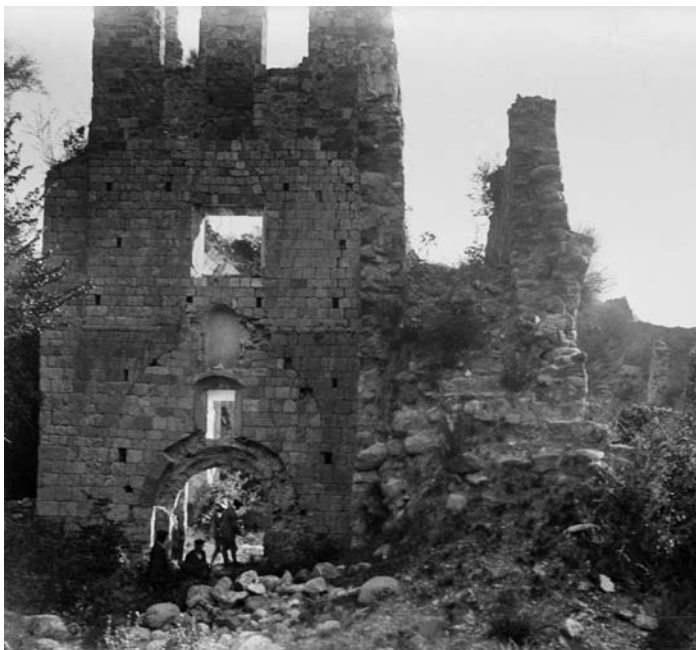
El Pont de Suert. Monestir de Santa Maria de Lavaix, 1907.