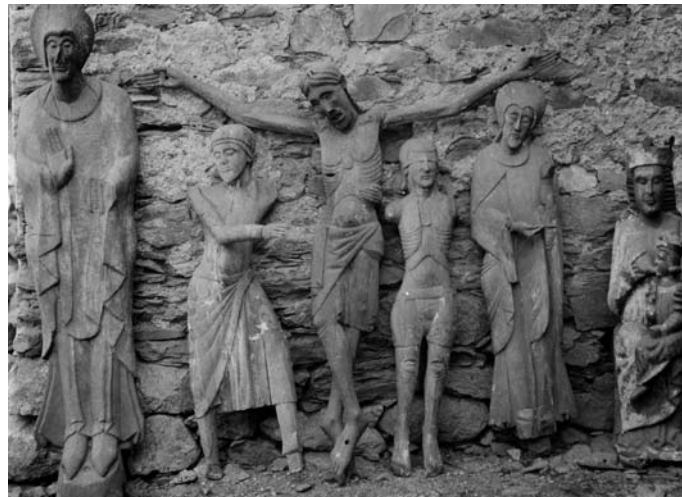
Tauill. Església de Santa Maria. Figures de dos davallaments i imatge de la Mare de Déu de la Llet, 1907.